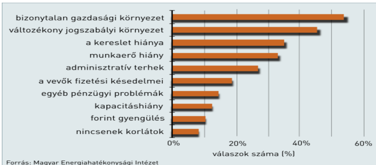
Akadályozó tényezők a cégek életében (Több válasz is adható volt)

A cégek mindennapjait akadályozó tényezők között a kereslet hiánya „dobogós” helyen végzett most is. A tavalyi felmérés eredményeihez viszonyítva ebben az ágazatban is megjelent új elemként a munkaerőhiány.